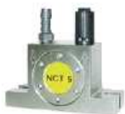
Vibrador pneumático rotativo